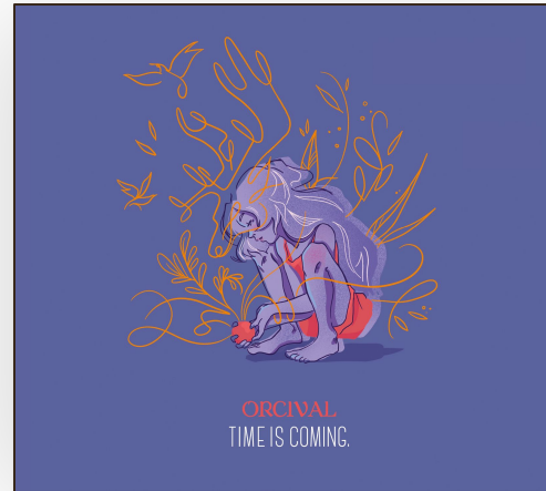
Time Is Coming (2021)