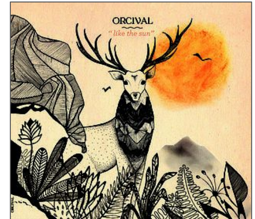
Like The Sun (2017)